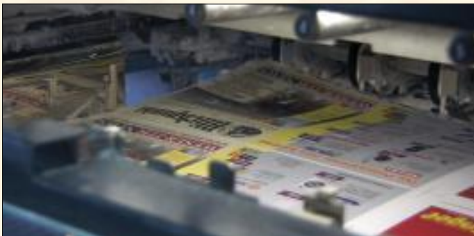
Hier wird mit Hochdruck gedruckt: Der neue Blickpunkt läuft vom Stapel.

Insgesamt viermal im Jahr erscheint der Blickpunkt, nachdem er im vergangenen Jahr das erste Mal nach über zwanzig Jahren Pause wieder neu aufgelegt wurde. Doch wie entsteht eigentlich eine solche Zeitung? Welche Arbeitsschritte sind nötig, damit aus einem bloßen Text ein richtiger Bericht wird und aus einem großen Papierstapel allmählich der Blickpunkt entsteht? Wir geben einen Blick hinter die Kulissen und zeigen, wie das Magazin Blickpunkt hergestellt wird.