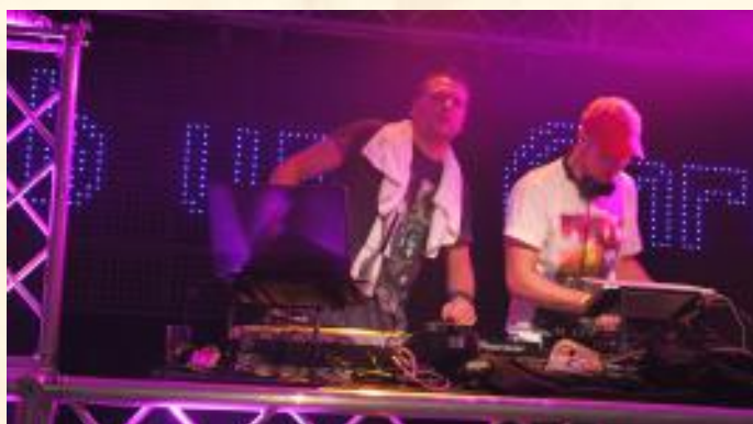
Die europaweit mit ihren Hits bekannt gewordenen Musiker "Rob und Chris" waren eines der Highlights. Normalerweise legen sie nur in großen Clubs auf.

Geil“ waren wahre Party-granaten. Und auch D3cay und R3lay, die vor dem großen Zeltpublikum ihre neuen Singles vorführten, kamen bei der feiernden Masse sehr gut an. Zufriedene Gesichter überall, eine tolle und vor allem friedliche Party zur dritten Zelt Disco in Lenne.