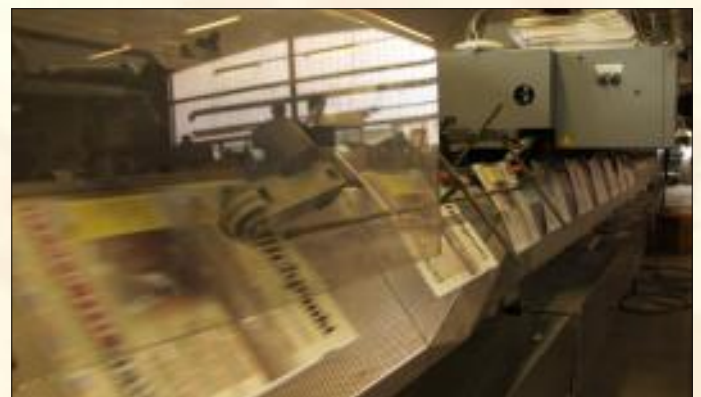
Ganz schön schnell werden an dieser Maschine die einzelnen bereits gefalzten Druckbögen zusammengetragen und letztlich in der Mitte geheftet. Heraus kommt der fertige Blickpunkt.

mit einer großen Schneidemaschine beschnitten. Den Blickpunkt könnte man jetzt schon fast durchblättern, doch es fehlt noch das endgültige Zusammentragen.