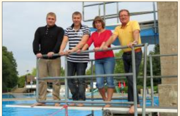
Die neu ausgebildeten Beckenaufsichten, hier nach erfolgreicher Prüfung im Freibad Polle. Nächstes Jahr werden sie in Stadtoldendorf für Sicherheit sorgen.

Inzwischen haben sogar die ersten Freiwilligen die Prüfungen zur Beckenaufsicht erfolgreich ablegen können. Wegen des nahenden Saisonendes konnten diese in diesem Jahr allerdings nicht mehr aktiv werden, für das kommende Jahr darf jedoch durch den zeitweiligen Einsatz dieser ehrenamtlichen Helfer ein nicht unwesentlicher Beitrag zur finanziellen Entlastung der Samtgemeinde erwartet werden.