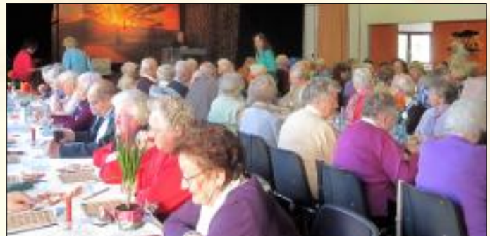
Stets ein voller Saal: Die Seniorenveranstaltungen in Stadtoldendorf erfreuen sich großer Beliebtheit und sind nicht selten bis auf den letzten Platz besetzt.

Für Seniorinnen und Senioren, die sich den Aufgaben des Alltags nicht mehr voll gewachsen fühlen oder deren Familie in größerer Entfernung lebt, für diejenigen ist der Seniorentreff Stadtoldendorf mit seinem umfangreichen Angebot eine gute Anlaufstelle. Der Seniorentreff hilft den Senioren, ihre Selbstständigkeit weitestgehend zu erhalten und am öffentlichen Leben teilzunehmen. Mit einer allgemeinen Beratung zu den möglichen Pflegesituationen, darunter ambulante, Kurzzeit- oder Tagespflege, hilft der Seniorentreff beispielsweise auch