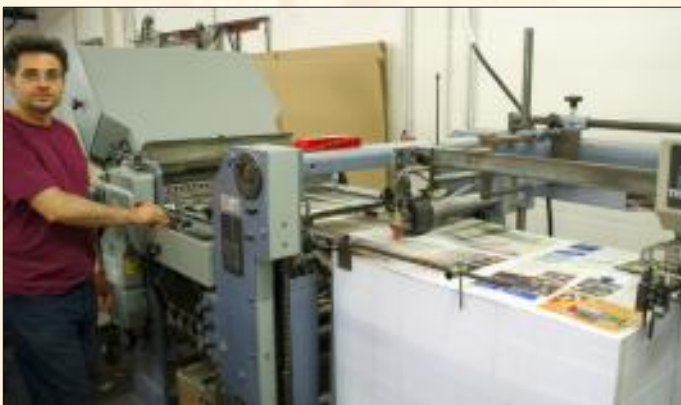
An dieser Maschine (Foto oben) werden die Druckbögen gefalzt. Das spätere DinA4-Endformat wird nun erstmalig sichtbar (Foto unten).

überwacht. Die großen Papierbögen werden mit hoher Geschwindigkeit durch die Druckanlage gezogen und mit Farbe bedruckt. Am Ende stapeln sich bereits die großen Druckbögen des Blickpunktes, ein erstes Qualitätsergebnis ist sichtbar. Wir sind hochzufrieden! Mehrere Stunden hat es nun gedauert, bis wir die Druckbögen allesamt in den Händen halten können. Doch davon kann man den Blickpunkt noch lange nicht durchblättern, denn es folgen noch einige weitere Arbeitsschritte.