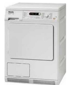
Abb. in Weiss

Kondens-Trockner • unterbaufähig • Schontrummel • 6 kg Füllmenge • elektronische Steuerung • Zeitsteuerung • 11 Programme • Programmablaufanzeige • Startzeitvorwahl • Restzeitanzeige • Trommelinnenbeleuchtung • Energieeffizienzklasse B • Breite: 595mm • Höhe: 850mm • Tiefe: 580mm